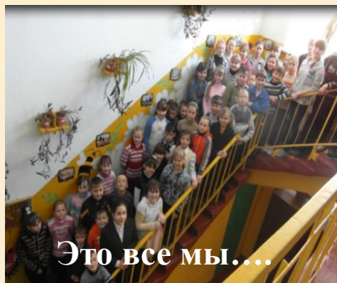
Это все мы....