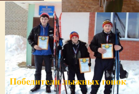
Победители лыжных гонок