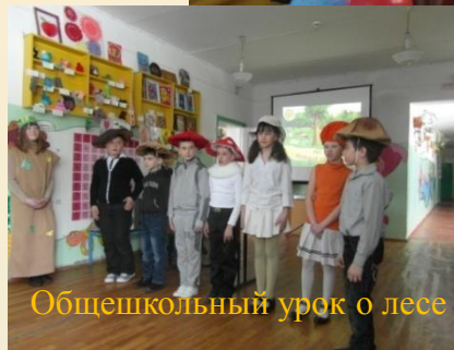
Общешкольный урок о лесе