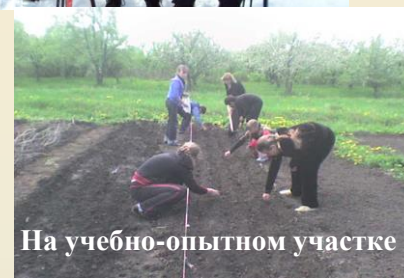
На учебно-опытном участке

14 февраля 1977 год – день открытия Заревской восьмилетней школы. Здание построено по типовому проекту на 192 места. 1990 год – восьмилетняя школа реорганизована в Заревскую среднюю школу. В школе работают детские объединения дополнительного образования. На базе спортивного зала работают спортивные секции. Всего учащихся в школе – 70чел. Сейчас в школе работает 14 педагогов, из них 5 учителей имеют первую квалификационную категорию. Один педагог награжден значком «Отличник народного просвещения», многие учителя награждены грамотами Министерства образования Рязанской области, областной и районной думой, УО и МП, школьными грамотами. Ежегодно выпускники 11 класса успешно сдают ЕГЭ. Школа сотрудничает с международной организацией ГРИНПИС. За 40 лет школа выпустила более 400 человек, в том числе 7 золотых медалистов, 1 серебряный медалист.